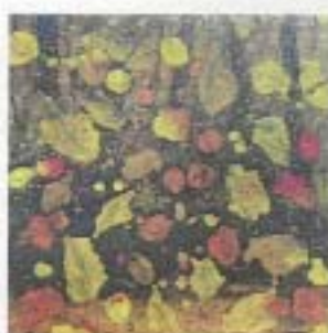
HOJAS DE OTOÑO

• Año: 2002 • Técnica: Óleo • Medidas: 11x11 cm.